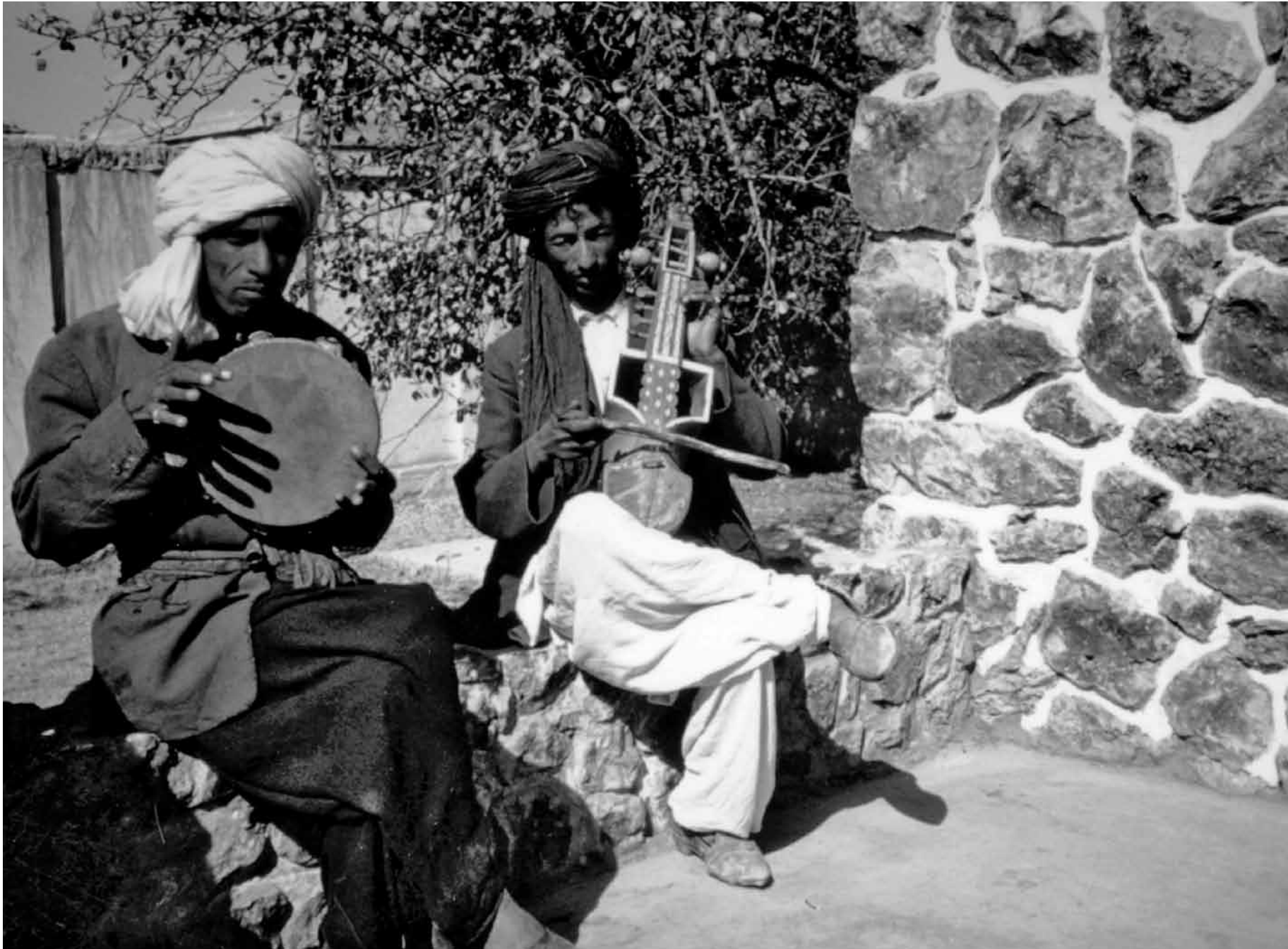
Musicians in the garden