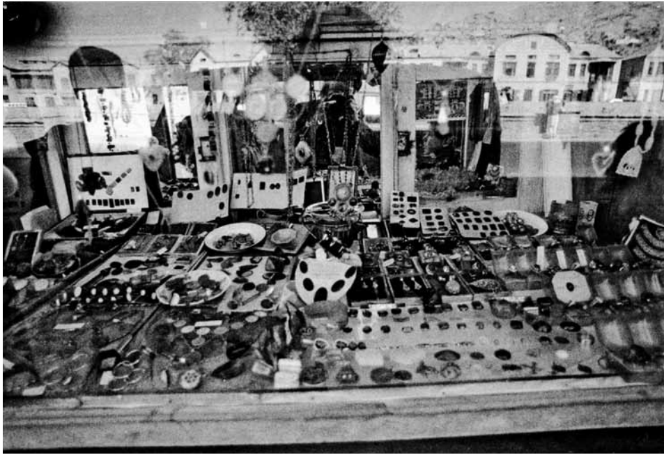
A shopwindow photographed by Alighiero (reflected in the glass)

Ein Schaufenster, fotografiert von Alighiero (der sich darin spiegelt)