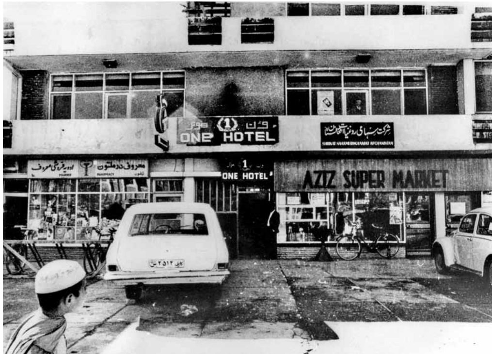
One Hotel, Kabul, 1972