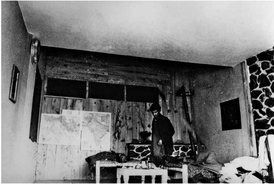
Left: One Hotel, Dastaghir in a partitioned-off room Below: Guests in one of the rooms