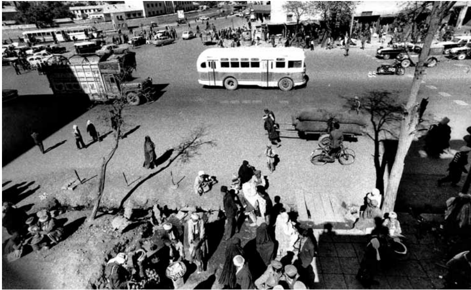
The street along the Kabul River, from the terraces of the Parsa Hotel, 1972

Die Straße und das Ufer des Kabul, Blick von den Balkonen des Hotels Parsa, 1972