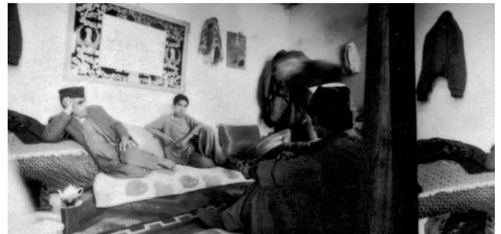
Links: One Hotel, Dastaghir in einem abgeteilten Zimmer Unten: Gäste in einem der Zimmer